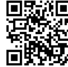
Figura 1.4 – QRcode com link para o vídeo no YouTube do comercial da Apple – Think Different ( http://www.youtube.com/watch?v=eUMFt_OImjA ).

O posicionamento deve ser feito antes de qualquer plano de marketing, pois envolve um nível estratégico superior, que precisa ser respeitado em todas as ações referentes ao produto/marca.