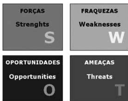
Figura 1.3 – Exemplo de uma Matriz Swot.

Os itens levantados são, então, colocados em forma de matriz, facilitando a visualização e análise (Figura 1.3).