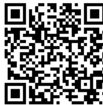
Figura 1.2 – QRcode de acesso ao artigo “Paradigm shift” na Wikipédia, em http://en.wikipedia.org/wiki/Paradigm_shift .

Sugiro a leitura do conceito de Paradigm shift , na Wikipédia, para aprofundar os conhecimentos sobre paradigmas e o impacto de suas mudanças na sociedade e, particularmente, no marketing. A figura 1.2 apresenta o QRcode que dá acesso ao texto.