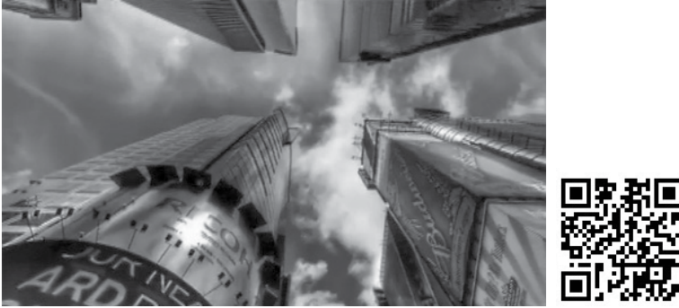
Figura 1.5 – Imagem do vídeo O que é Branding 3.0? com QRcode de acesso ( www.vimeo.com/6285424 ).